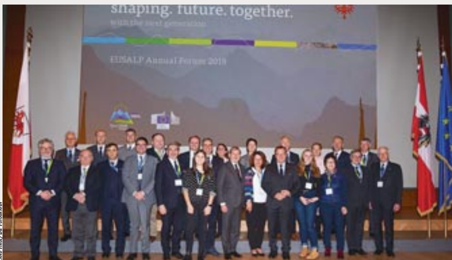
Le deuxième forum de la SUERA a rassemblé près de 250 participants à Innsbruck.

Sous la devise « Façonner l'avenir avec la prochaine génération », cette rencontre a de nouveau permis d'avoir une vision d'ensemble des dynamiques alpines de coopération, coordonnées et impulsées par la stratégie macrorégionale. Aux côtés de la délégation française constituée de représentants de l'État (Commissariat général à l'égalité des ter-