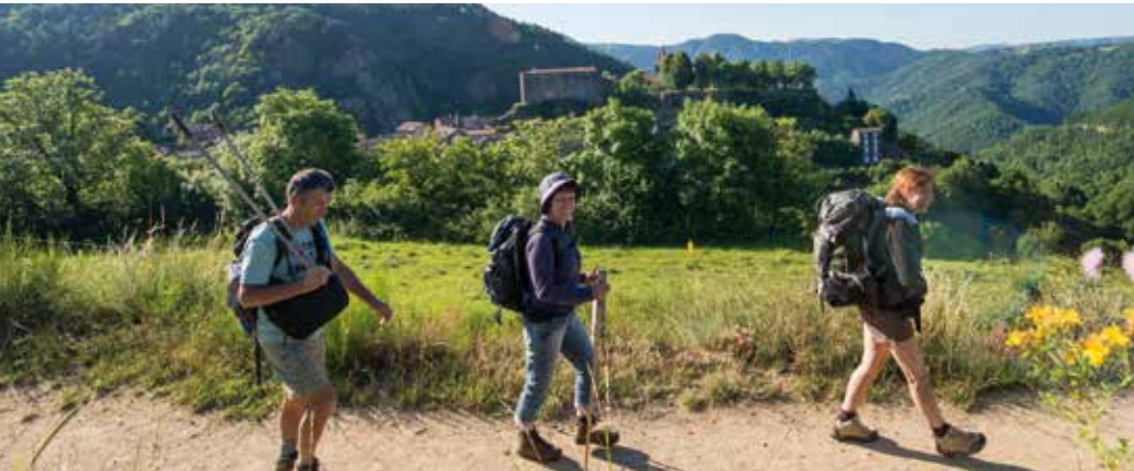
Saint-Privat d'Allier, sur le chemin de Compostelle